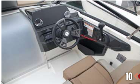
10. El puesto de gobierno está perfectamente adaptado a esta embarcación, y cumple con todo lo exigible en cuanto a seguridad y ergonomía.

Recordar también que, como en las demás Quicksilver, existe un pack Smart para completar el barco con los opcionales más básicos.