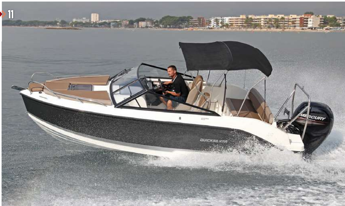
11. Con el Mercury de 150 Hp, la potencia máxima para la 605 Cruiser, se superan los 37 nudos de punta, y se mantiene un régimen de crucero de unos 24 nudos con todo confort.