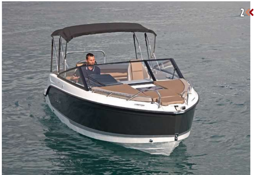
1. La 605 Cruiser es una pequeña cabinada ideal como barco de día, espaciosa y con notable versatilidad en la bañera. 2. La proa, con balcón abierto, adopta una colchoneta de solárium de tres piezas.

motor, el coste final viene a suponer un ahorro de algo más de un diez por ciento.