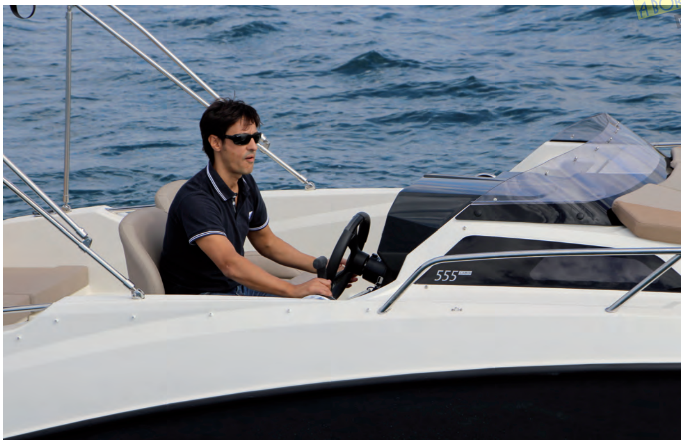
El piloto queda bastante alejado del discreto parabrisas.

La última versión de cubierta de la Quicksilver Activ Cabin 555 permite convertir una pequeña lancha de navegación costera en un auténtico mini daycruiser con buena habitabilidad y posibilidades de equipamiento para aumentar el confort.