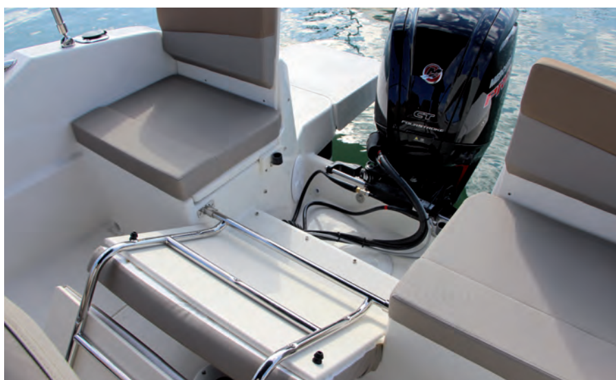
Abatiendo el respaldo se puede elevar el motor totalmente.