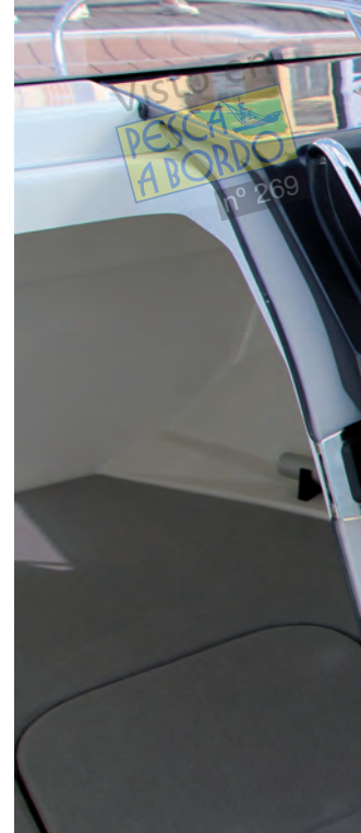
Para navegación cuenta con dos asientos giratorios y practicables.