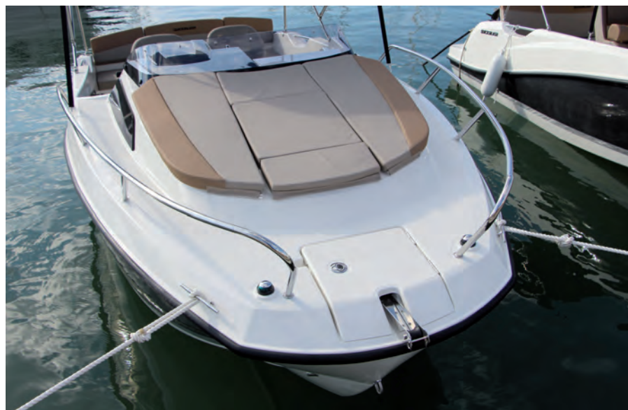
La proa cuadrada conforma un amplio solárium y buena plataforma de entrada.

También es interesante el hecho de que se trata de una embarcación que podremos manejar simplemente con la Licencia de Navegación y transportarla sin esfuerzo en un remolque.