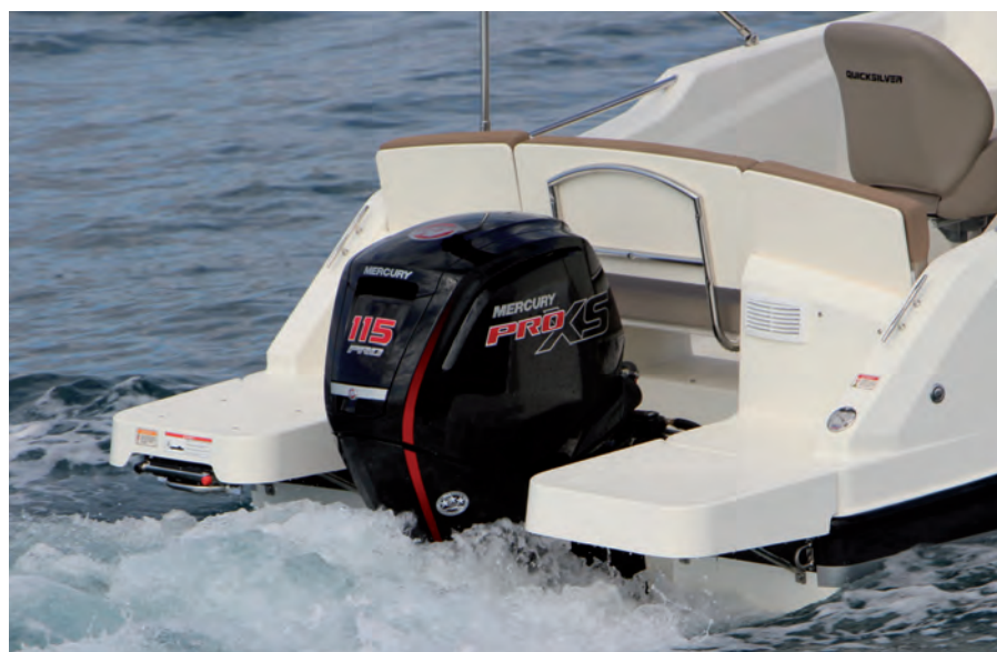
Con las dos plataformas de popa se facilita la recogida de capturas.

En este aspecto, el concepto cabin de Quicksilver reside en integrar adecuadamente una cabina ocupando la proa sin restar espacio en la amplia bañera. Además, existe la posibilidad de cerrar totalmente la zona exterior mediante un elevado toldo plegable y unas coberturas laterales transparentes, ofreciendo la máxima protección y haciendo más agradable la vida a bordo.