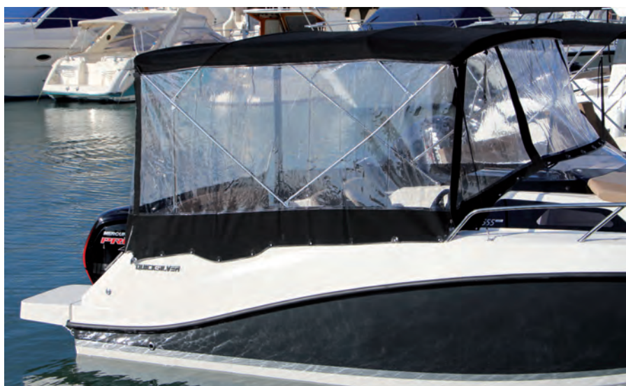
Existe la opción de cerrar toda la bañera con suplementos del toldo bimini.