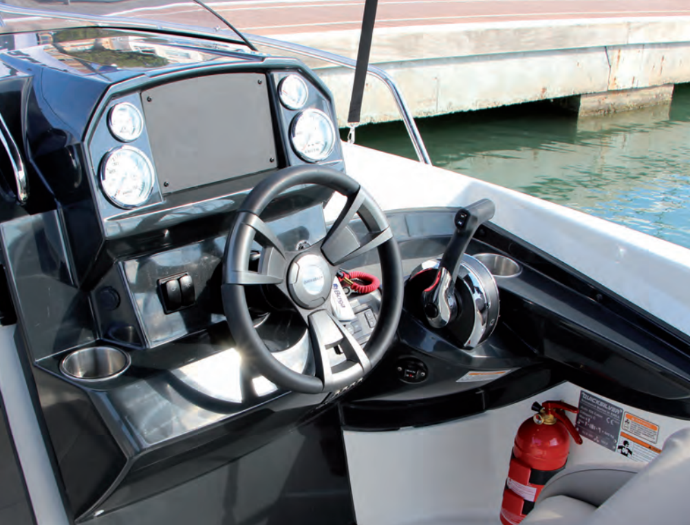
Dispone de un frontal central para una pantalla multifunción.