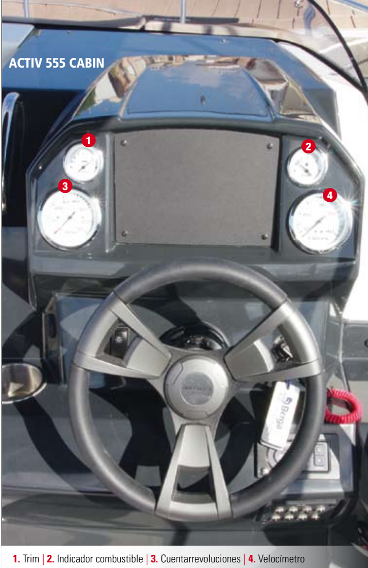
1. Trim | 2. Indicador combustible | 3. Cuentarrevoluciones | 4. Velocímetro