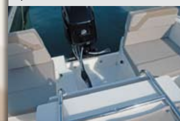
De forma opcional, la sección central del sofá de popa será abatible hacia proa para poder subir el motor.