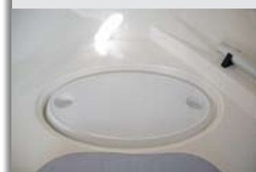
La mesa de la bañera quedará perfectamente estibada en cabina. La superficie bajo la colchoneta frontal y el pie, en el lateral.