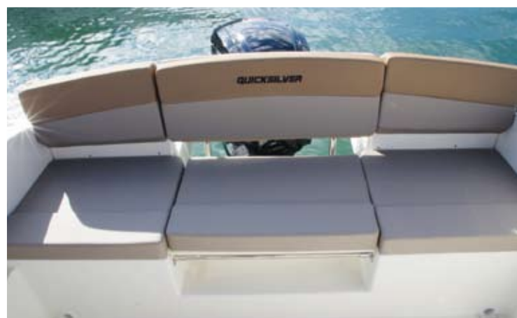
La sección central de la base del sofá trasero queda abierta, de forma que podrá emplearse para estibar los accesorios que requieran estar más a mano sin entorpecer la circulación.