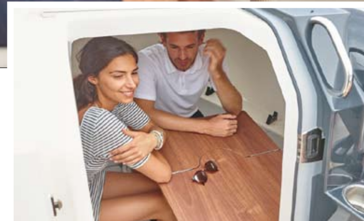
La extensión central de la cama de la 555 servirá, además, para convertir el área en una dinette protegida de los elementos.