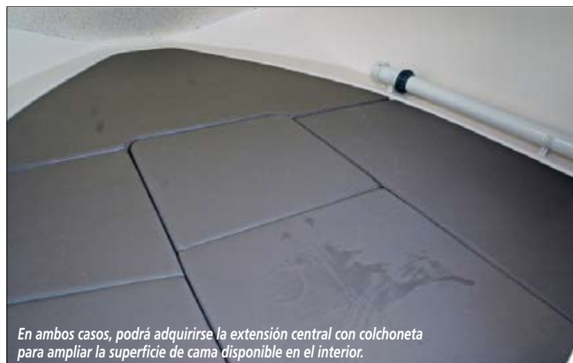
En ambos casos, podrá adquirirse la extensión central con colchoneta para ampliar la superficie de cama disponible en el interior.