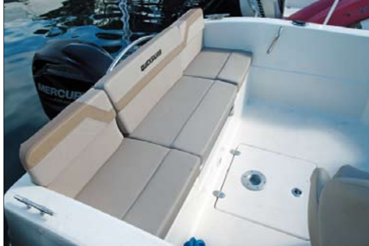
Con un respaldo de buena altura, el sofá transversal de popa resulta muy confortable.

La elevación de sus proas crea una cabina compacta con un equipo básico para poder descansar o destinar su volumen a la estiba. Si bien los dos espacios cuentan con una cama en V con una extensión central opcional, una mesa permitirá convertirlo en dinette en la 555. Ésta incorpora, además, una escotilla que amplía la luz y la ventilación de la zona. ■■■