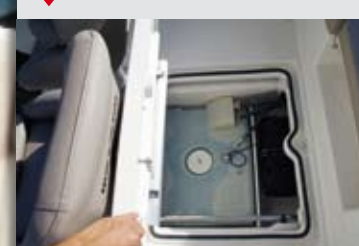
El cofre de la bañera de la 555 es más amplio y su tapa se dota de un práctico pistón a gas para facilitar su apertura.