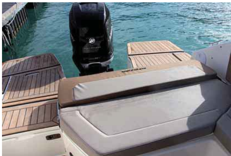
La popa se abre completamente abatiendo el respaldo posterior.

Con una eslora sobre los 7 metros, se trata de una lancha de buenas prestaciones con un buen volumen, que adopta una proa de profunda V sobre cuya cubierta, protegida por unos bajos candeleros, ofrece una buena superficie totalmente acolchable para tomar el sol, además de un cofre de fondeo con molinete interior. El parabrisas de gran inclinación ofrece una sección central practicable para acceder a una estrecha escalera integrada con la que bajar a la amplia bañera en la que discurrirá la mayor parte de la vida a bordo. En la parte delantera se sitúa el asiento del copiloto, de respaldo reversible, frente a una guantera alta, mien-