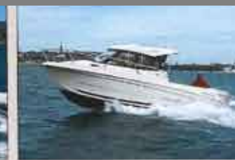
• Bénéteau Antarès 780 Prix : 30 500 € sans moteur – Long. : 7,23 m – Larg. : 2,78 m – Mot. maxi : 200 ch – Constr. : Bénéteau (85)