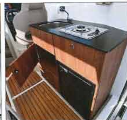
The kitchen presents many closets, but the refrigerator and stove are proposed in option ( € 1,520 ).