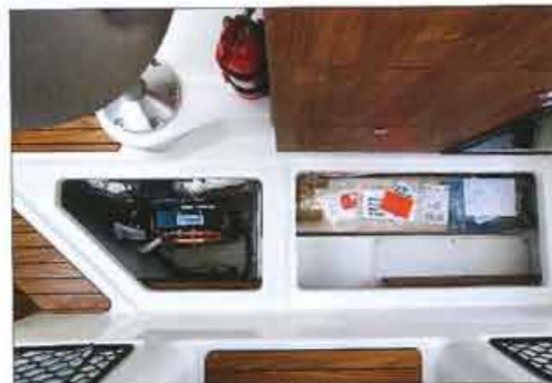
The interior floor has very practical storage compartments. The one on the left houses the air conditioning (optional).

Displayed at a fairly competitive price, finishing with a serious and very cleverly arranged, the new Quicksilver 755 Weekend seems born. This boat which is aimed especially at small cruise shows nevertheless versatile, but its level of somewhat poor standard equipment needed to dip into the options packages offered by the manufacturer.