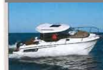
• Jeanneau Merry Fisher 795 Prix : 34 500 € sans moteur – Long. : 7,43 m – Larg. : 2,81 m – Mot. maxi : 200 ch – Constr. : Jeanneau (85)