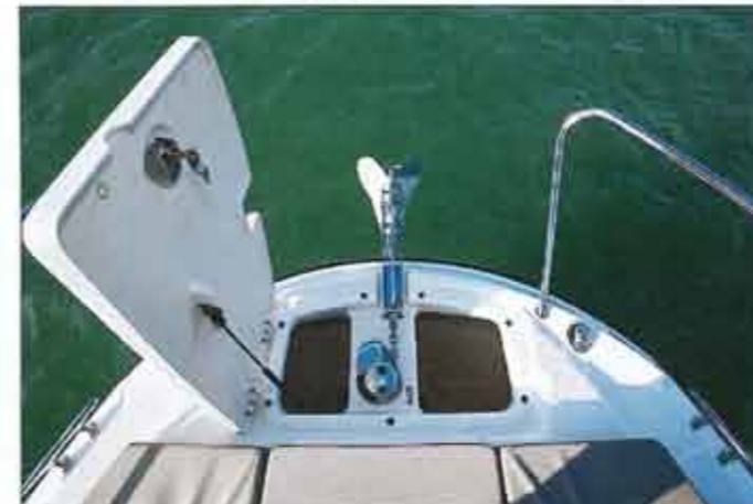
The anchor is a beautiful depth. The electric windlass is optional, but it is in the Smart Edition pack.