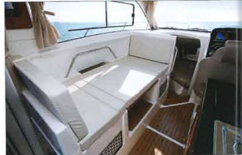
The cockpit floor is home to large chests with a deep bunker . The covers are supported by solid cylinders.