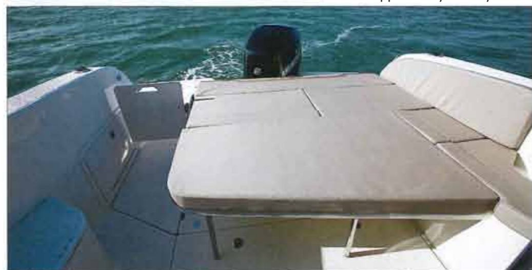
The cockpit table (available as an option only) lowers to form a vast sunbathing (1.58 x 1.68 m).

The cockpit floor is home to large chests with a deep bunker. The covers are supported by solid cylinders.