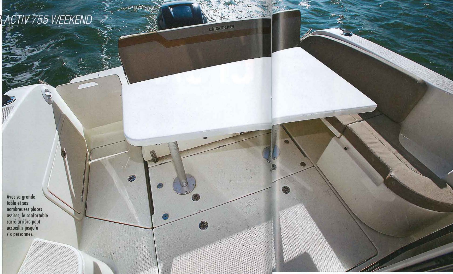
Avec sa grande table et ses nombreuses places assises, le confortable carré arrière peut accueillir jusqu'à six personnes.

Le carré, situé sur bâbord, est modulable en couchage lorsque la table est abaissée; il s'agit cependant d'une couchette d'appoint pour un enfant car elle ne mesure que 1,59 mètre de long. Les deux banquettes en vis-à-vis se montrent très confortables pour deux personnes, mais elles sont un peu étroites pour quatre adultes. La cuisine qui fait face au carré dispose de nombreux rangements très pratiques. Malheureusement, le réfrigérateur et le réchaud à gaz sont en option (1 520 €). Le poste de barre bénéficie d'un tableau de bord très moderne et d'un magnifique volant, mais il manque un vide-poche en hauteur et la commande des gaz est placée trop bas, surtout quand le pilote est debout. Les autres commandes – comme celles des flaps – tombent bien sous les mains et l'emplacement réservé au com-