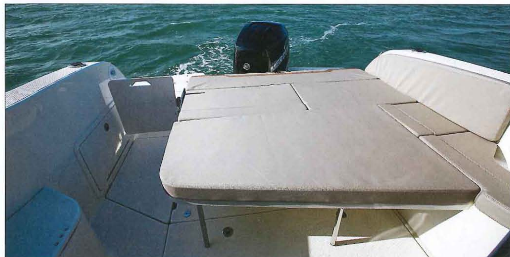
La table du cockpit (proposée uniquement en option) s'abaisse pour former un vaste bain de soleil (1,58 x 1,68 m).