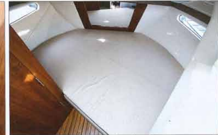
The double bed of the front cabin is placed at an angle. It is large enough to comfortably accommodate two adults. The two hull ports are very significant.