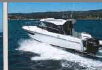
• Parker 750 CC Prix : 38 985 € sans moteur – Long. : 7,46 m – Larg. : 2,50 m – Mot. maxi : 300 ch – Distrib. : réseau