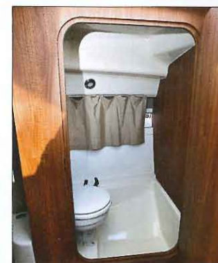
Les WC fermés (en option) ne disposent ni de douchette ni de lavabo.