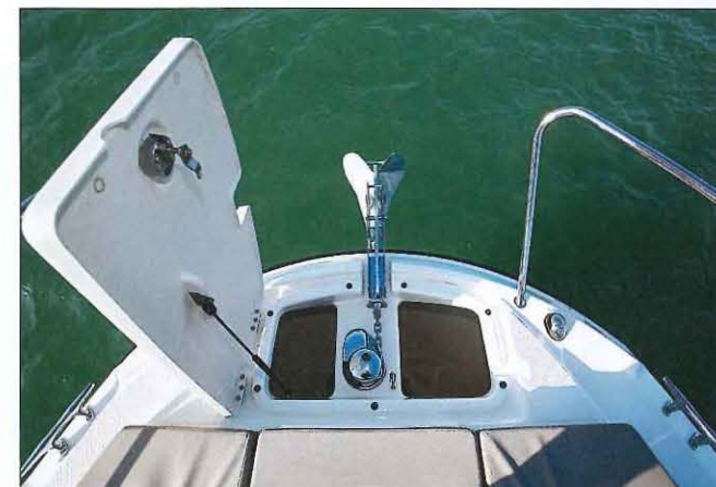
La baigne à mouillage est d'une belle profondeur. Le guindeau électrique est en option, mais il figure dans le pack de l'Édition Smart.