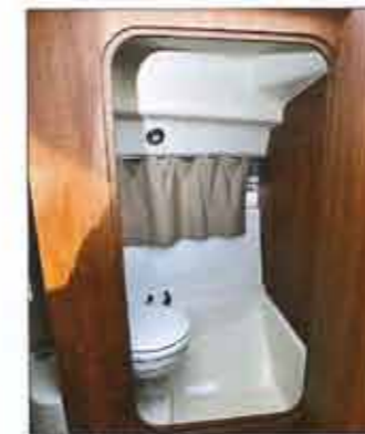
Closed toilet (optional) have neither shower or sink.