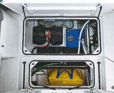
Le plancher du cockpit abrite des grands coffres dont une soute très profonde. Les capots sont assistés par de solides vérins.