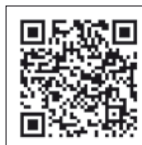
Video Quicksilver Captur 905 Pilothouse (Quicksilver)