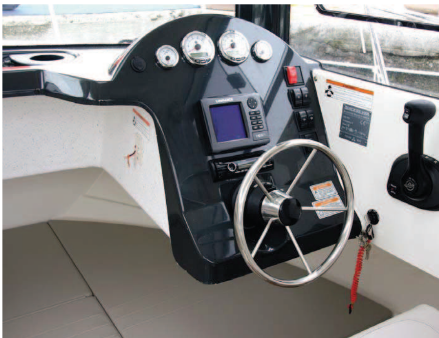
La sencilla consola queda colgada de la base del parabrisas.

Por su parte el resto de la cabina queda ocupado por una cama triangular realizada sobre diversos cofres de estiba que podría contar con suplementos para ampliar su tamaño.