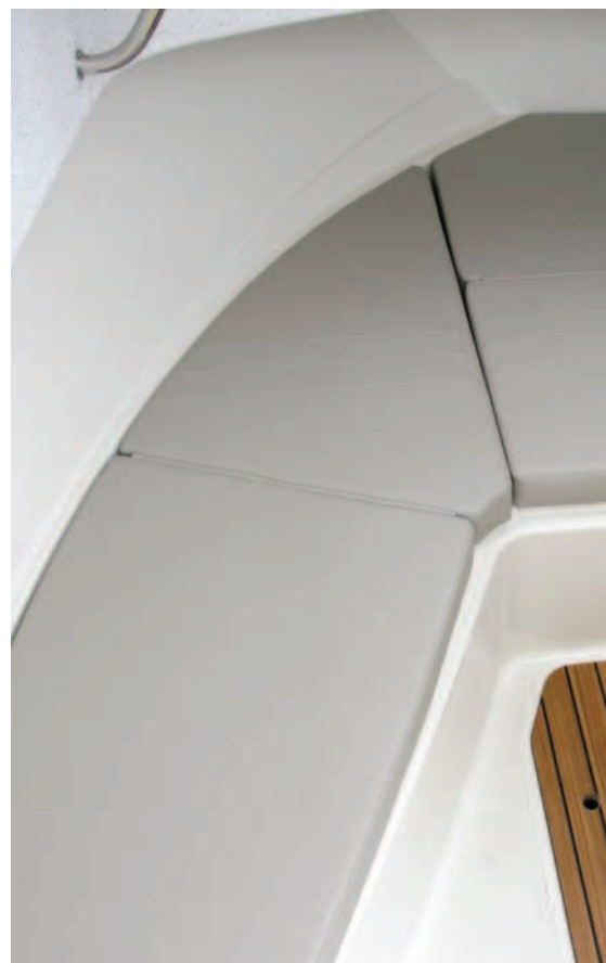
En proa, la cama triangular puede servir para descansar o estibar cañas.

plataformas de baño que rodean la prebañera, dotada de escalera cubierta por una tapa y que conecta con el pasillo de entrada.