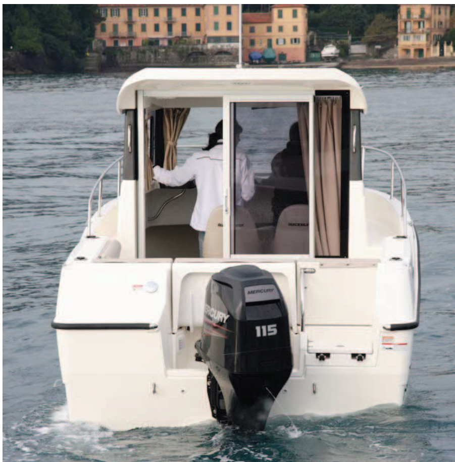
Cuenta con una popa alta que ofrece buena protección posterior.