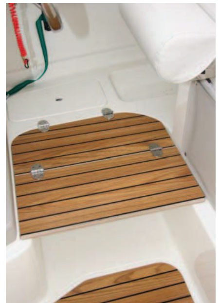
El reposapiés plegable permite variar la altura del piloto a voluntad.

Los pasillos que rodean la cabina, asimétricos para ampliar el volumen interior, son de tamaño suficiente para alcanzar con bastante seguridad la cubierta de proa, en donde únicamente ofrece un cofre de fondeo con molinete exterior y balcón abierto.