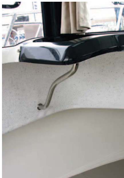
Algunas paredes precinden del acabado de contramolde.