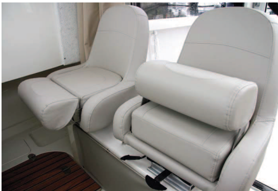
Dos asientos de base practicable se montan sobre una elevada estructura.