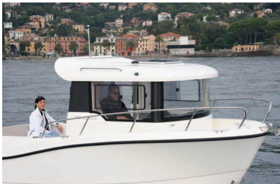
La cabina queda muy adelantada y mantiene sus formas rectas.