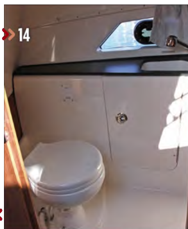
14. El gabinete del aseo incluye de serie lavabo, inodoro y ducha, además de armarios y un portillo de ventilación.