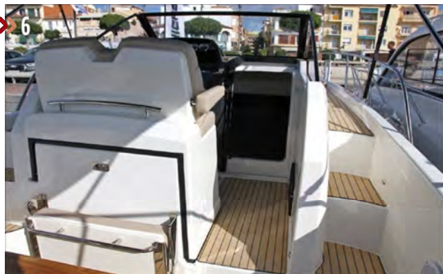
6. La idea de contar con un paso lateral ancho por estribor permite ganar espacio en la bañera y en la cabina.