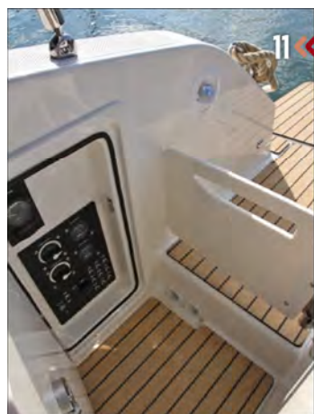
11. La popa dispone de paso directo. Aquí un armario esconde los desconectores de baterías del barco.

En mar abierto y con mar incómoda de fondo, el barco se comportó