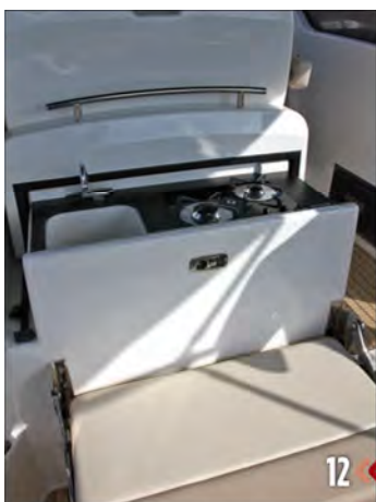
12. El mueble de cocina aparece desplazando el asiento del piloto y acompañante hacia delante mediante raíles.