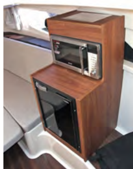
La cabina es voluminosa, con una dinete convertible a proa, y un mueble de servicio a estribor.

bien, y a pesar de que contaba con el sistema de flaps de serie, apenas los necesitamos para asentar bien el barco. Basta con los trims de los Verado. En todo caso, los flaps se utilizarán con mar de costado.