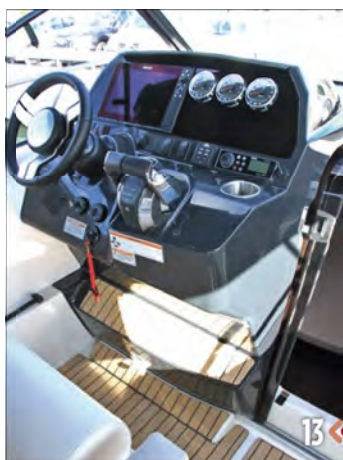
13. El puesto de gobierno está muy bien diseñado y dispone de todo lo necesario.